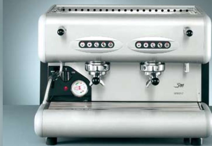
85 Sprint E