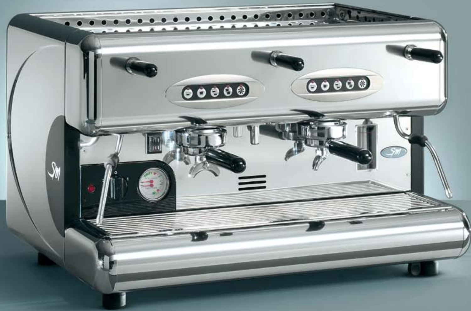
85 E 2 GR.