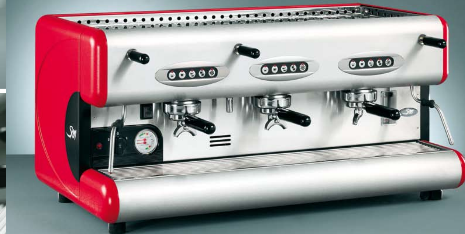
85 E 3 GR.