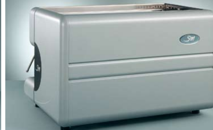
85 E 2 GR.