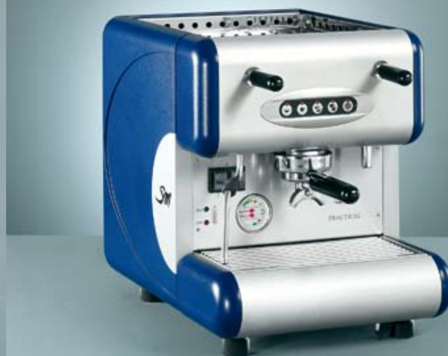
85 Practical E