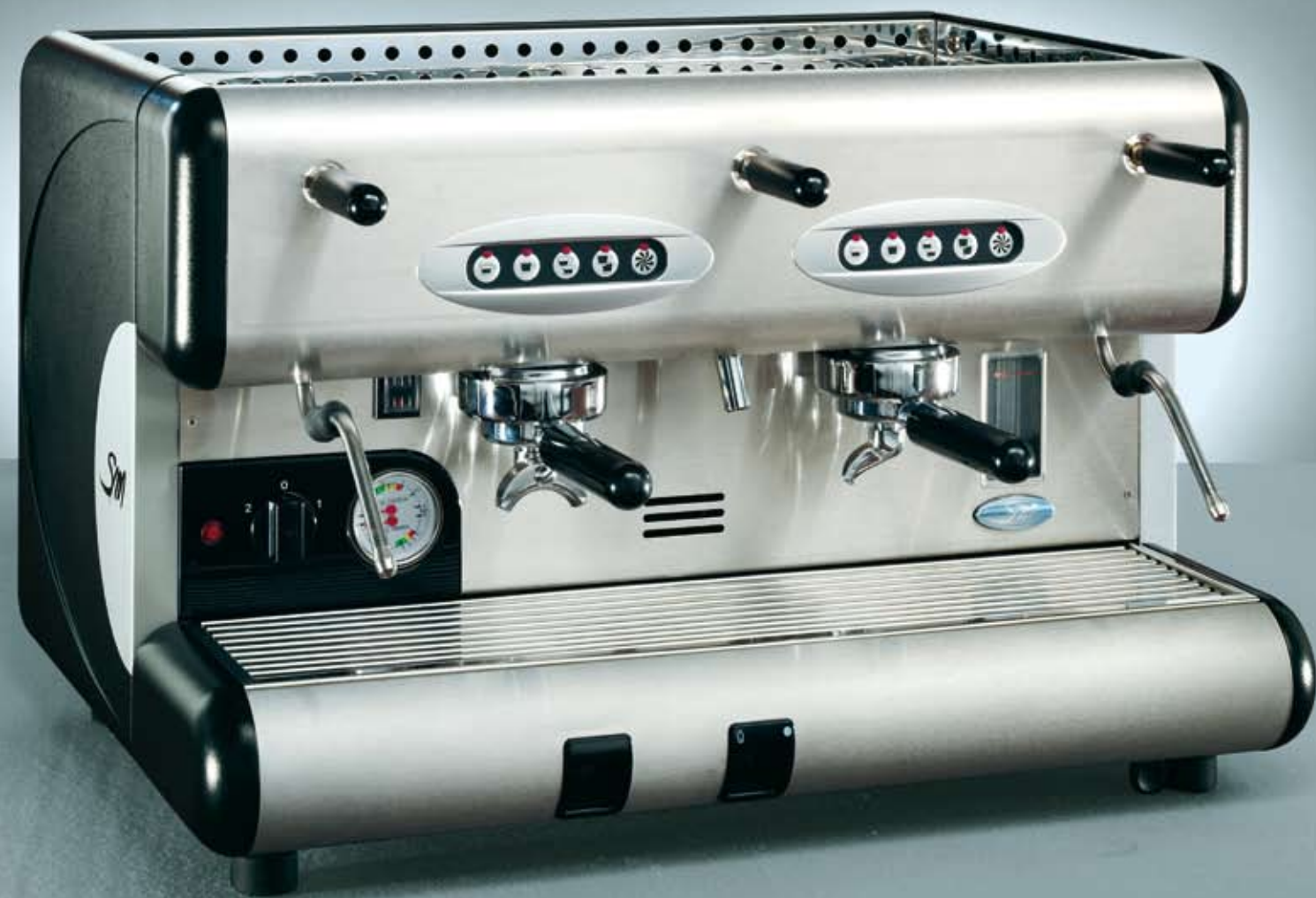
85 E 2 GR.